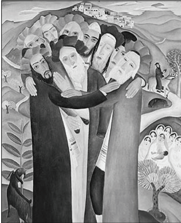
ראובן רובין - הרוקדים ממירון, 1926

בבית ראובן, ברחוב ביאליק בתל אביב, מציגים ציורים של הצייר ראובן רובין.