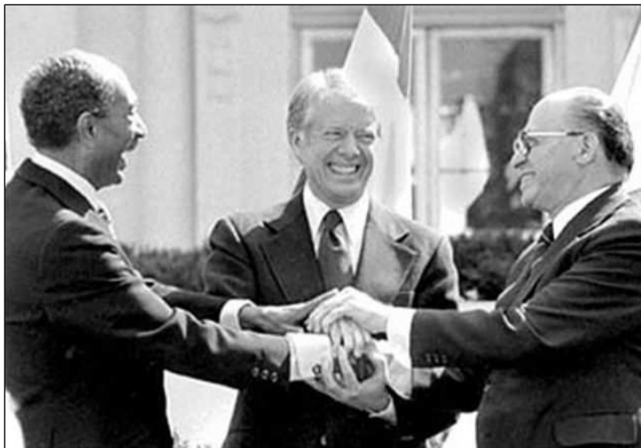
בגין, סאדאת וקארטר בטקס חתימת הסכם השלום, בבית הלבן בושינגטון, 26 במארס 1979

במארס 1979 חתמו נשיא מצרים, אנואר סאדאת וראש ממשלת ישראל, מנחם בגין, על הסכם שלום בין שתי המדינות. טקס החתימה נערך בבית הלבן בושינגטון. חוזה השלום קבע, כי ישראל תחזיר למצרים את חצי האי סיני, שכבשה במלחמת ששת הימים (1967), ובין שתי המדינות יהיו יחסי שלום מלאים. הסיסמה של המנהיגים הייתה: "לא עוד מלחמה, לא עוד שפיכות דמים" - סיסמה שמשמשים בה עד היום. חוזה השלום נחתם בזכותו של הנשיא האמריקני, ג'ימי קרטר, שהגיע לירושלים ולקהיר כדי לדבר עם שני הצדדים. כנסת ישראל אישרה את חוזה השלום ברוב גדול. 95 חברי כנסת תמכו בחוזה השלום, ואילו 18 חברי כנסת התנגדו לו. ב-10 בדצמבר 1978 בגין וסאדאת קיבלו פרס נובל לשלום באוסלו שבנורווגיה. התגובות בעולם הערבי היו קשות. הרבה מוסלמים התנגדו לדרכו של סאדאת, ואיימו לרצוח אותו. באוקטובר 1981 מוסלמים קיצוניים רצחו את סאדאת, בשעה שצפה במצעד צבאי לציון שמונה שנים למלחמת יום כיפור (1973). סגנו, חוסני מובארק, מנהיג את מצרים עד היום.