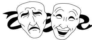
מסכה / מסכות

אדיב שמרני מְרוֹצֵה לעומת זאת ממוצע קֶצֶב החיים דעה קדומה / דעות קדומות מסכה / מסכות תזונה תכונה / תכונות עצה / עצות