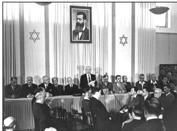
טקס הכרזת העצמאות

חלוצים מעפילים מגינים טֶבַח שארית הפליטה קיבוץ גלויות מצפון נציגות מערכה הגשמה שאיפה גאולה תקומה